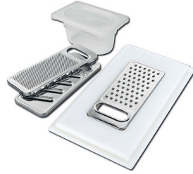
Kit râpes avec anneau de support et cuvette

* uniquement en combinaison avec l'accessoire 8644 101